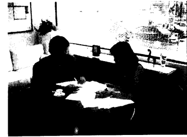
レジデンシー・プログラムアサイニーの会議風景

AZCAに常駐する顧客企業からのアサイニーは、AZCAの担当マネジング・ディレクターおよびアソシエイトとともにシリコンバレーにおけるチームを組み、日本本社サイ